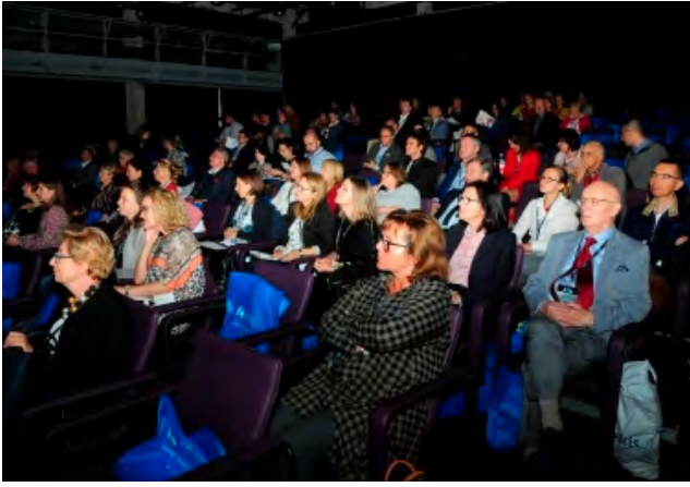
Konferencja PTA – 20. Dzień Andrologiczny, Lublin, 2018 r.