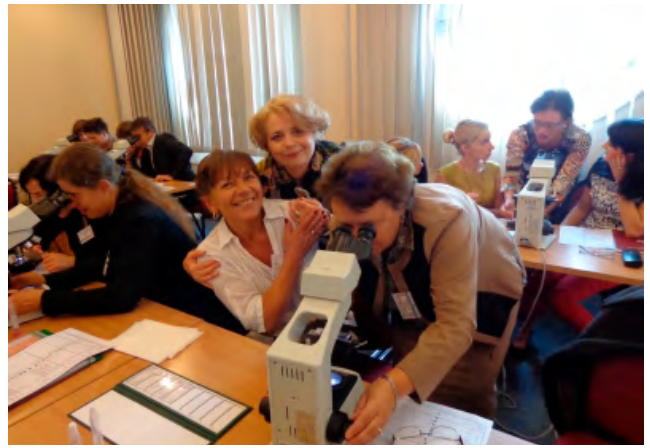
Kurs badania nasienia. Konferencja PTA – 15. Dzień Andrologiczny, Międzyzdroje, 2013 r.