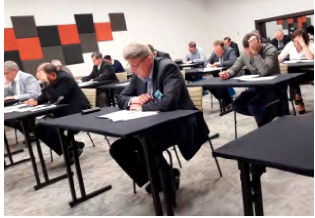
Egzamin do Certyfikatu z andrologii klinicznej. Konferencja PTA – 19. Dzień Andrologiczny, Kraków, 2017 r.

W grudniu 1994 r. PTA liczyło 190, a w grudniu 2019 r. – 258 członków zwyczajnych. Członkami PTA są lekarze, głównie o specjalizacjach ginekologia, endokrynologia, urologia, choroby wewnętrzne, a także diagnostyki laboratoryjnej, biolodzy, epidemiolodzy i lekarze weterynarii.