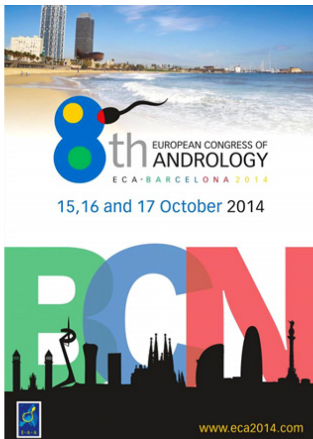
Plakat 8. Europejskiego Kongresu Andrologicznego

10 osób z różnych krajów europejskich. Wśród zdających byli endokrynolodzy i urolodzy. Podobnie, członkowie międzynarodowej komisji egzaminacyjnej reprezentowali te dziedziny. Ponieważ szkolenie odbywa się w akredytowanych ośrodkach EAA, poziom przygotowania merytorycznego, kandydatów z różnych ośrodków był równie wysoki, dzięki czemu wszyscy uzyskali certyfikat androloga klinicznego EAA. W Polsce ze względu na zmianę organizacji systemu specjalizacji pojawiają się nowe możliwości kształcenia lekarzy w różnych dziedzinach. Wierzymy, że dla urologów pojawi się możliwość szerszego kształcenia w dziedzinie andrologii. Byłaby to szansa na zdobycie wielokierunkowej wiedzy niezbędnej do holistycznego i nowoczesnego podejścia do pacjenta. W rękach urologów andrologia może stać się użytecznym narzędziem w opiece nad zdrowiem rodzczym i seksualnym mężczyzny.