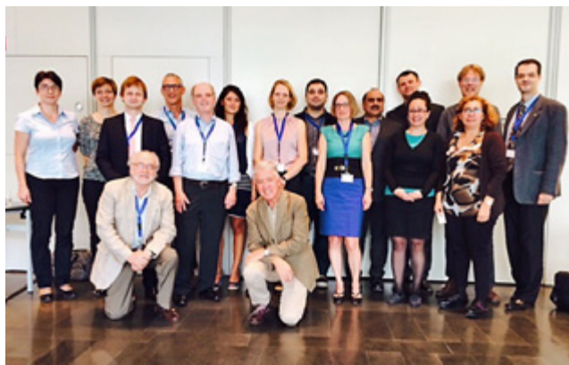
Kandydaci tuż po egzaminie z andrologii klinicznej w 2014 r. wraz z członkami komisji egzaminacyjnej